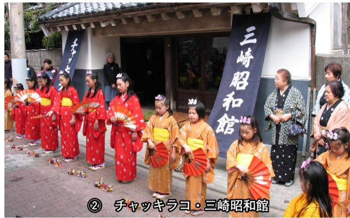
② チャッキラコ・三崎昭和館