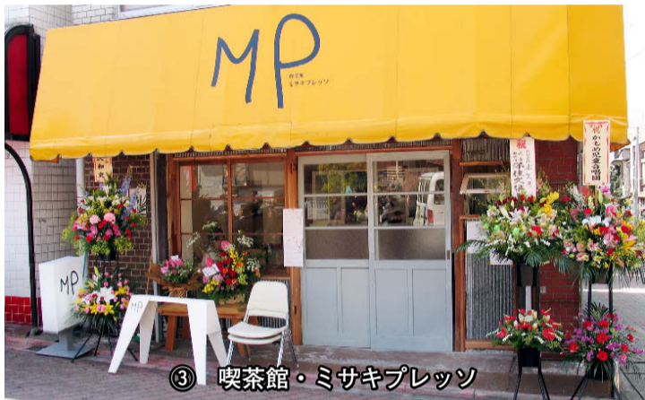
③ 喫茶館・ミサキプレッ