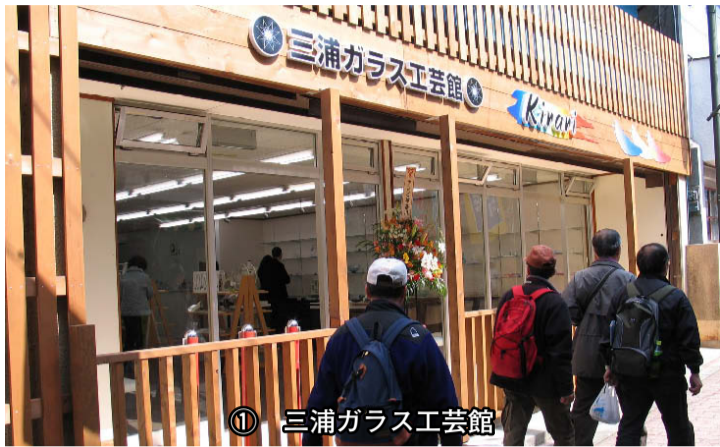
① 三浦ガラス工芸館