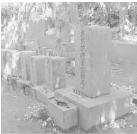
会津藩士とその家族の墓碑（大椿寺飛び地）

大椿寺（墓地内・飛び地・裏山）・最福寺（境内）・長善寺（飛び地）に所在。三浦市内には幕末の江戸湾防備に携わった会津藩士の墓所が、5箇所計37基所在する。江戸湾防備関係の遺跡は、確実にその場所が特定できるものは少なく、実物資料が現存していることは極めて貴重。