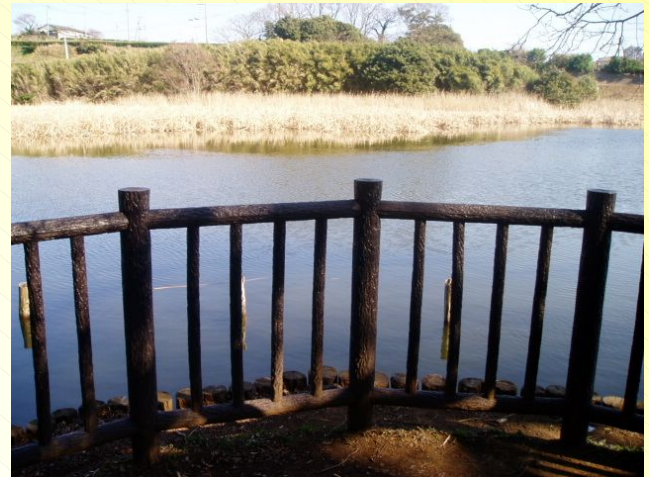
小松ヶ池展望スペース