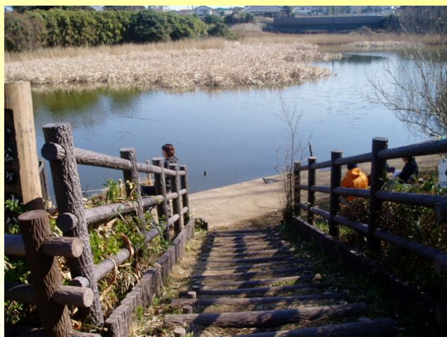
公園内階段設置状況