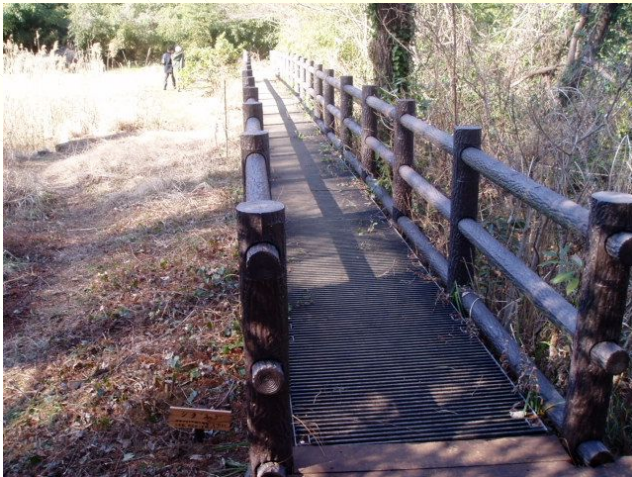
小松ヶ池周辺散策路