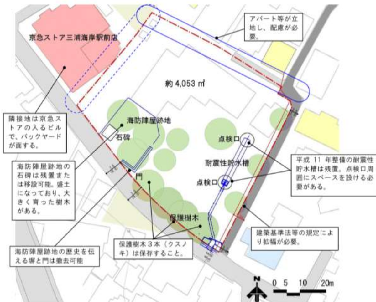
海防陣屋跡地の門と塀