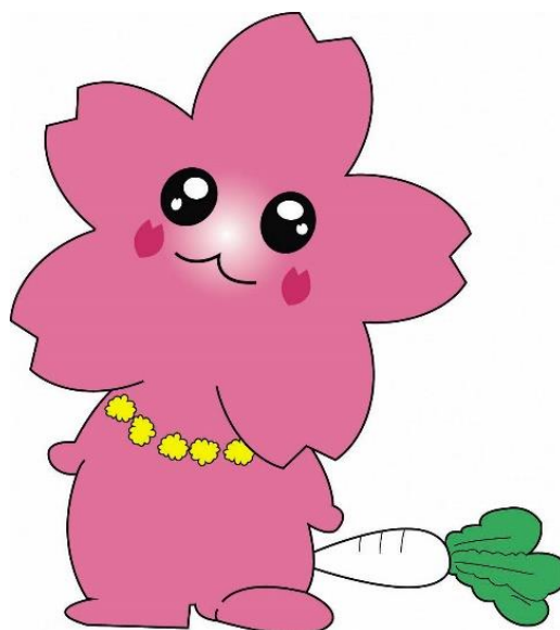
三浦海岸ご当地キャラクター みうらん