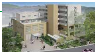
三浦市子育て賃貸住宅 完成予想図