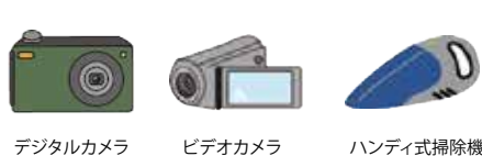
デジタルカメラ ビデオカメラ ハンディ式掃除機

※カメラ・ビデオは中の電池を外す。一体型/取り外せない場合は「破碎できないごみ」。できる限り使用済み小型家電回収BOXへ。