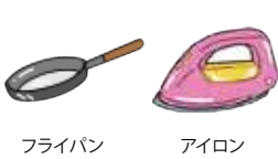
フライパン アイロン