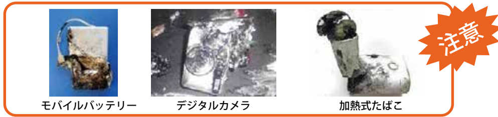
モバイルバッテリー

充電式小型家電などによる発火トラブルが急増しています！ プラスチック製容器包装(プラの日)に危険物や他のごみを入れないでください!! ～見た目がプラスチックでも収集日が違います～