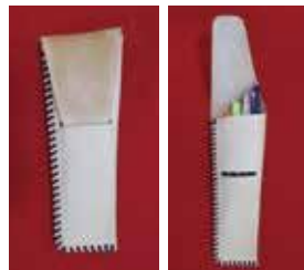
作品見本 （写真のものを作成し、表裏両面に100種類以上の刻印の中から選んで押していただきます。ペンはイメージで付属しません。）

申込受付期間 1月15日（木）9時～1月23日（金） 申込み・問合せ 電話または直接、南下浦出張所内文化スポーツ課講座担当にお申し込みください。（☎046-888-1111）