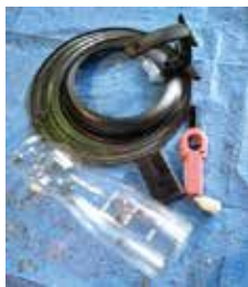
フライパンのフタ、使い捨てライター、びん

先日、プラスチック製容器包装の分別確認を行ったところ、ペットボトルやフライパンのフタ、医療器具（吸引器、医療用チューブ）などが排出されていました。プラスチック製容器包装はプラマークの付いたトレイ・パック・カップ、袋類・ラップ、チューブ類、プラスチックボトル類です。またプラマークの付いていないペットボトルのフタ、発泡スチロール、緩衝材は出すことができます。正しい分別にご協力をお願いします。