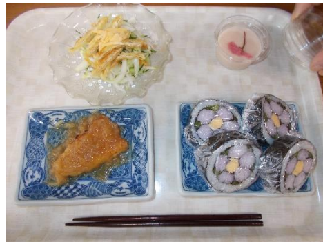
料理講座Ⅳ 飾り巻き寿司

この美しい自然や伝統を守り育て、次の世代へ引き継いでいくことが、必要であると考えています。このために、子どもから高齢者まで、市民一人ひとりが、様々な形で学習活動に取り組むことでお互いの個性や能力を伸ばし、生きがいに満ちた毎日を送るとともに、豊かな地域づくりという共通の目標に向けて共に学び合いお互いの知恵や経験を活かし合っていくことが求められます。