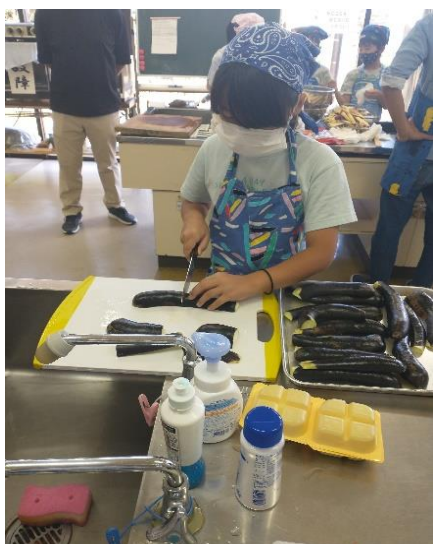
「親子農業体験教室 収穫祭」