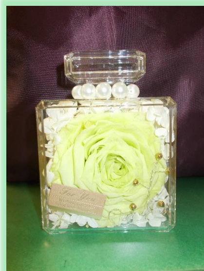
「工芸講座Ⅱ 香水瓶アレンジ」