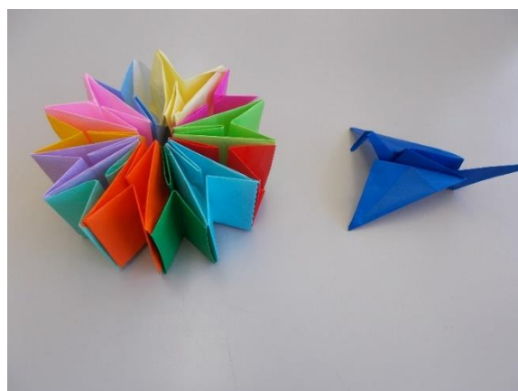
「みちしお学級 創作折り紙」