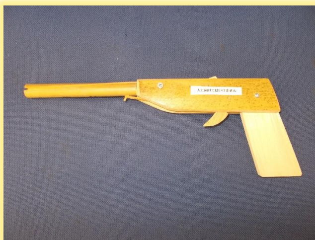
「したうら塾 竹細工教室」