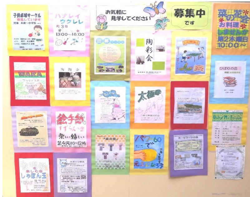
いろいろなサークルのポスター

はっせしめん 初声市民センターは、人びとにどのように利用されているので しょうか。