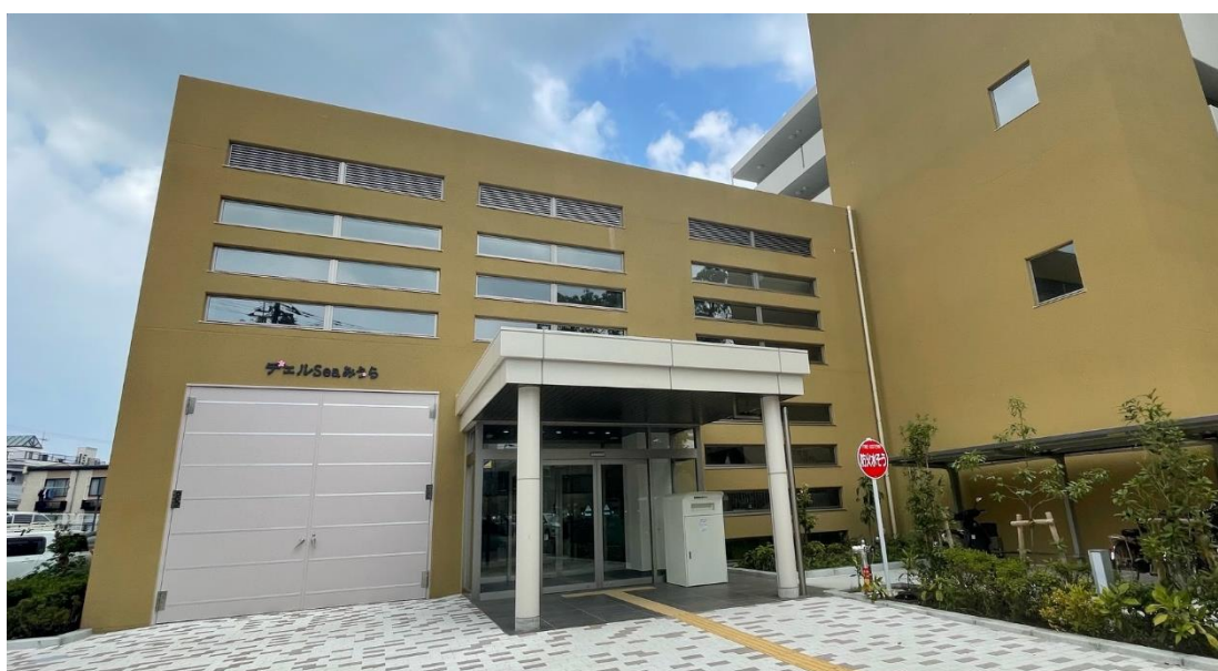
チェルSeaみうら（南下浦コミュニティセンター）

これらのしせつが、わたしたちの生活にどのように役立ってい るか、調べてみることにしましょう。