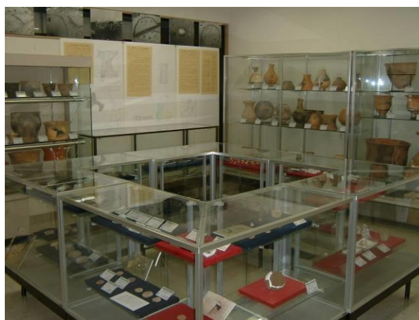
きょうどしりょうしつ 郷土資料室