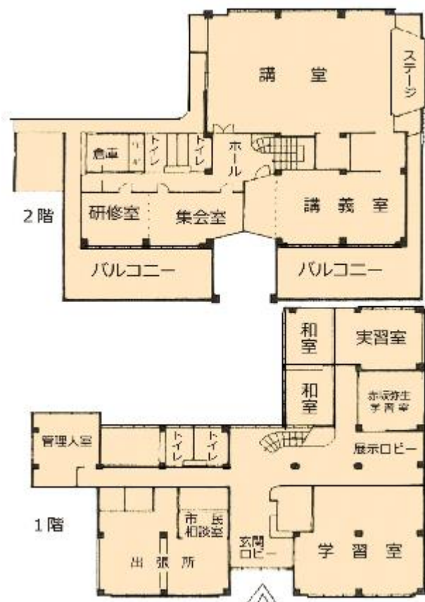
初声市民センターの中の様子

公民館 こうみんかん には、地いき ち の人びと ひと がだれでも利用できるような、 いろいろな設備 せつび が整えられ ています。