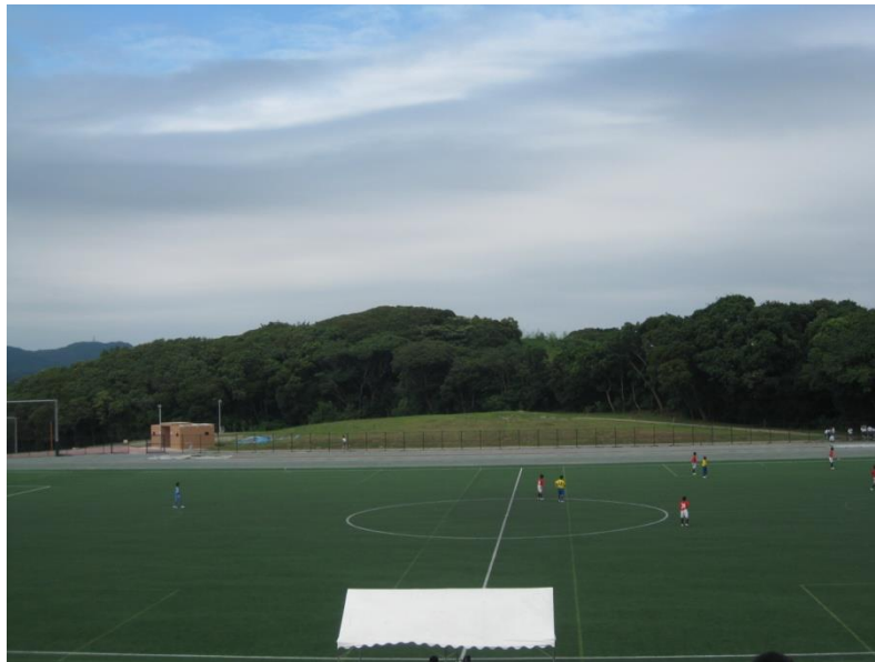
潮風スポーツ公園

三浦市には、今まで学 がく 習 しゅう したし し せつ せつ のほかにも、市 けん や県 けん のし せつ せつ がたくさんあります。