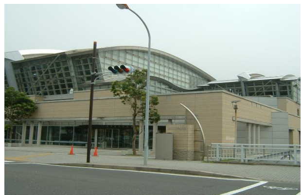
総合体育館・潮風アリーナ そうごうたいいくかん しおかせ