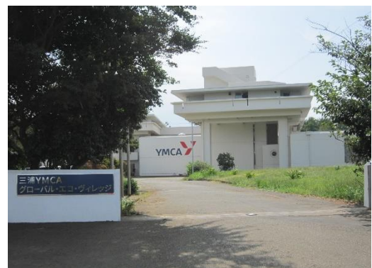
三浦YMCAグローバル・エコ・ヴィレッジ