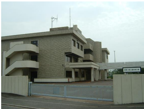
かながわけんみうらごうどうちやうしや 神奈川県三浦合同庁舎