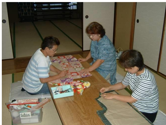
わしつ 和室