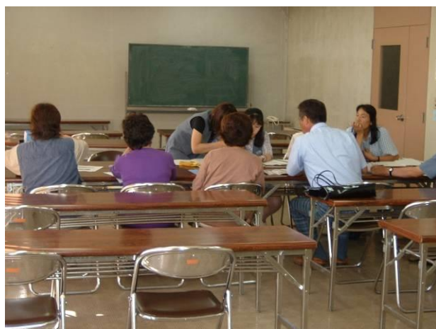
けんしゅうしつ 研修室