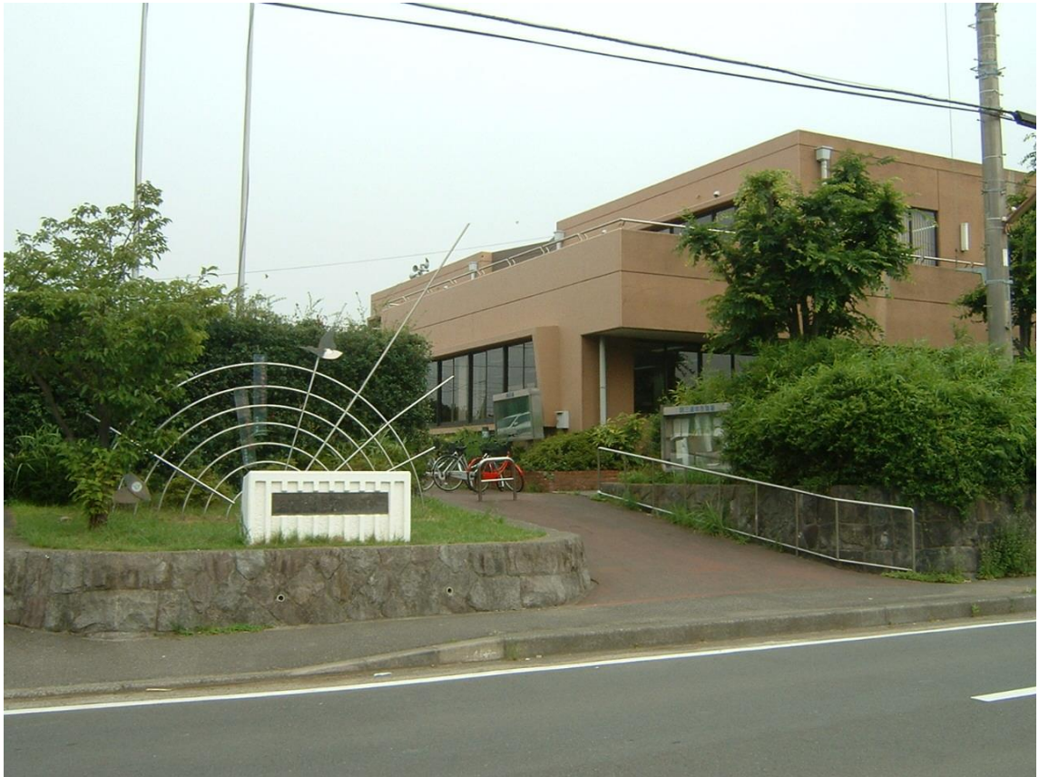
はっせしめん 初声市民センター