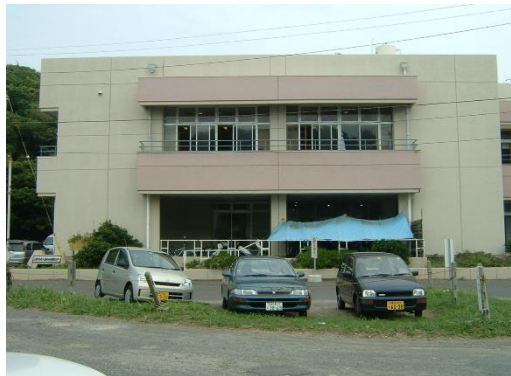
ろうじんふくしほけん 老人福祉保健センター（ もろいそ 諸磯）