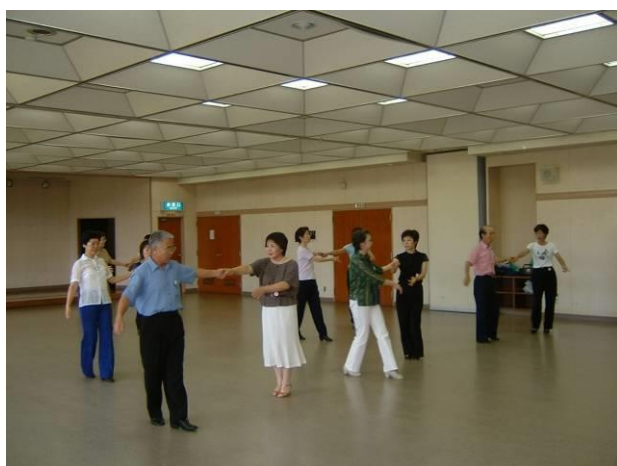
こうどう 講堂（編集委員撮影）