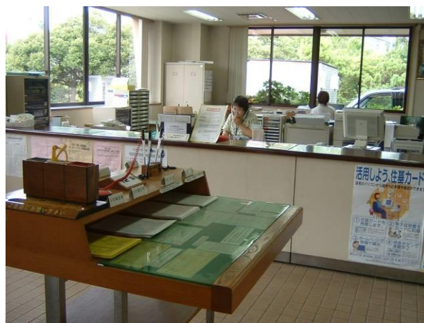
しやくしよしゅつちやうじよ 市役所出張所