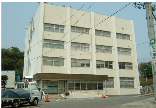
三浦市役所 しやくしょ