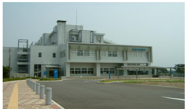
三浦市立病院 びょういん （編集委員撮影）