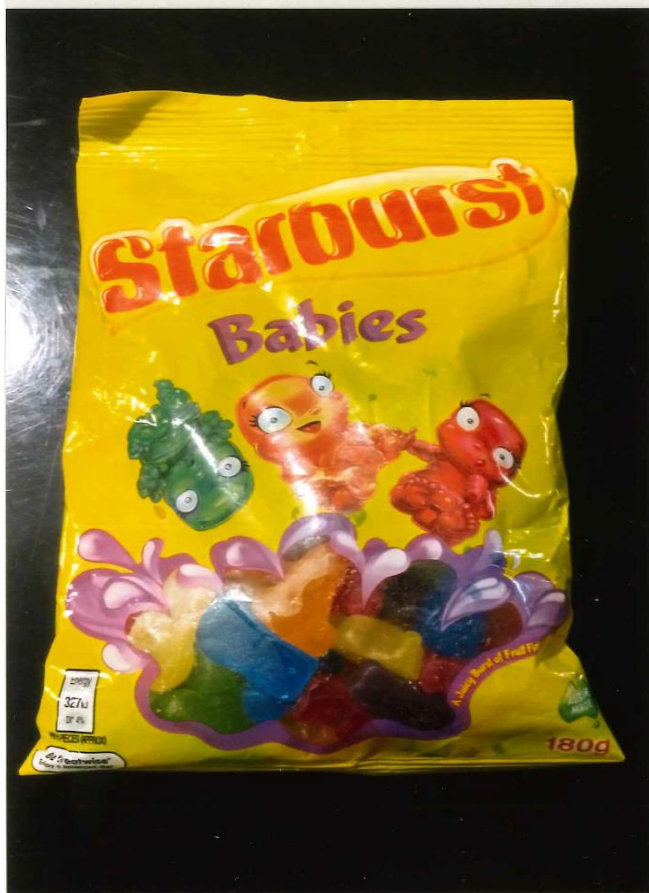
←Australiaで一番人気のスターバースト!!