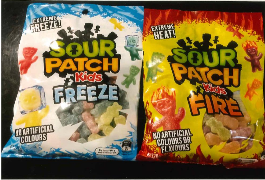
←Australiaで一番人気のおかし、サワーパッチキッズ!!