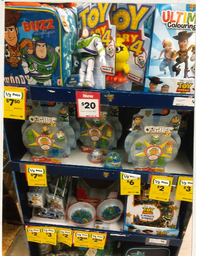
スーパーに売っている日米画のグッズ (トイストーリー-4)