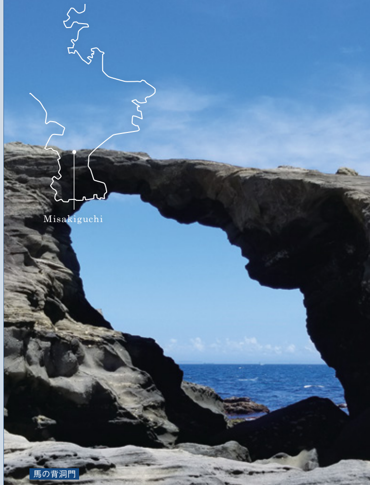
Misakiguchi Sta. Hasse Aburatsubo Misakishitamachi・Jogashima