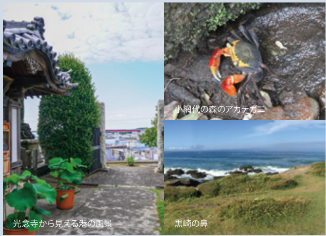
光念寺から見える港の風景 黒崎の鼻