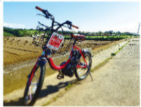
電動アシスト付レンタルサイクル (三崎口・三浦海岸・うらり・油壺)