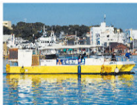
渡船 (三崎港・城ヶ島)