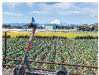
電動キックボード (三浦海岸・油壺)