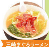
三崎まぐろラーメン