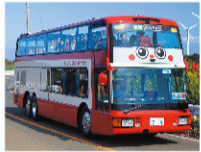
オープントップバス (三崎口)