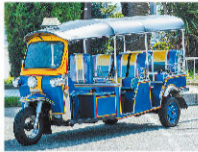
トゥクトゥク (三浦海岸)