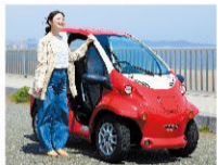
超小型BEVカー「my-mo」 (三浦海岸・三崎口・三崎港)