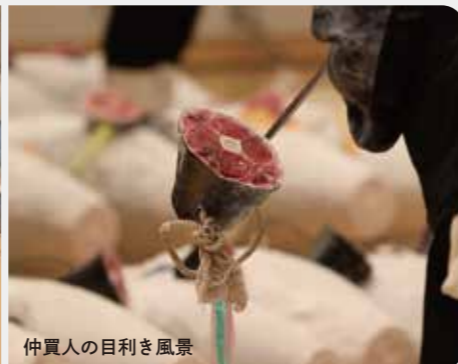
仲買人の目利き風景