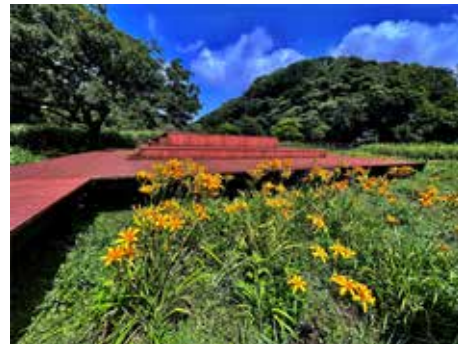
ハマカンゾウの咲くエノキテラス