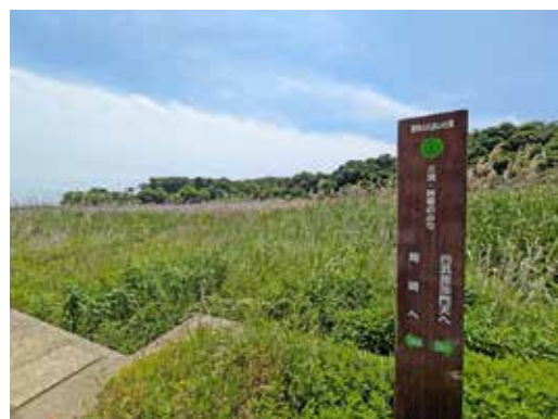
関東ふれあいの道