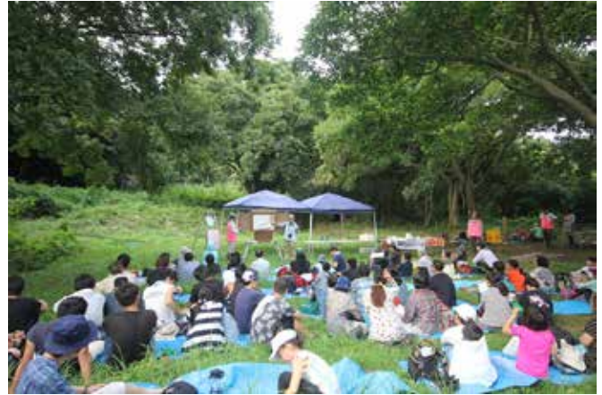
小網代の森での環境学習