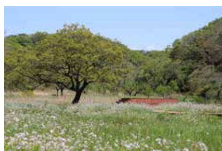
春のエノキテラス周辺