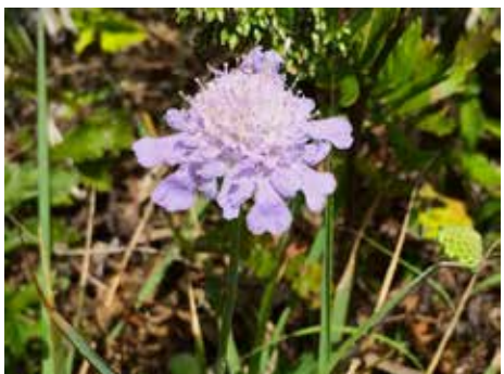
ソナレマツムシソウ