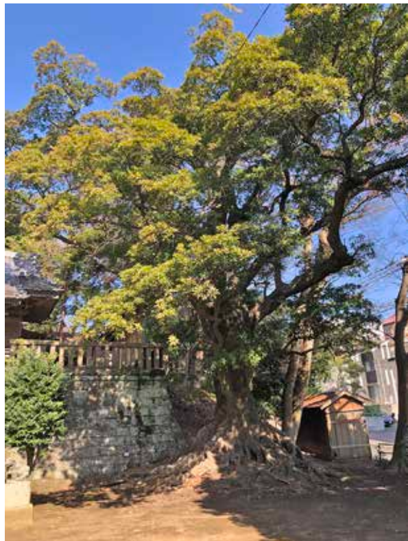
保護樹木 諏訪神社ホルトノキ