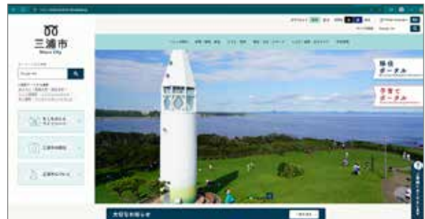
三浦市ホームページ