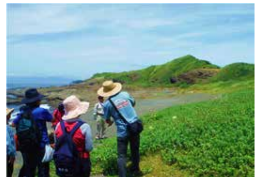
黒崎の鼻での自然観察会