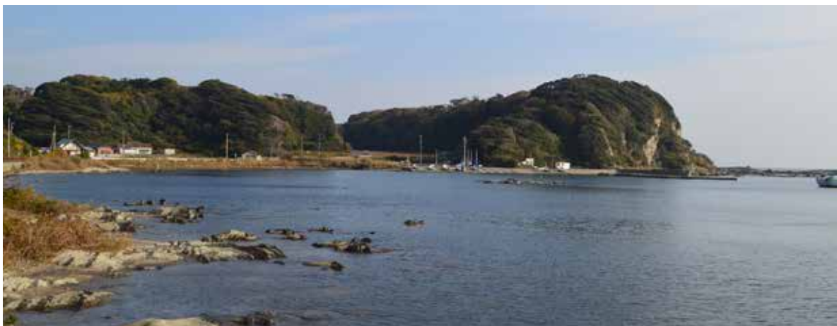
毘沙門湾と斜面樹林