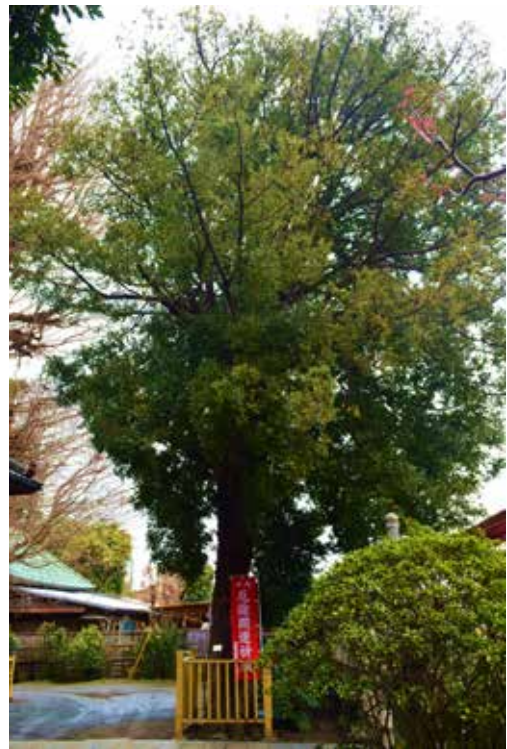
保護樹木 延寿寺のナギ