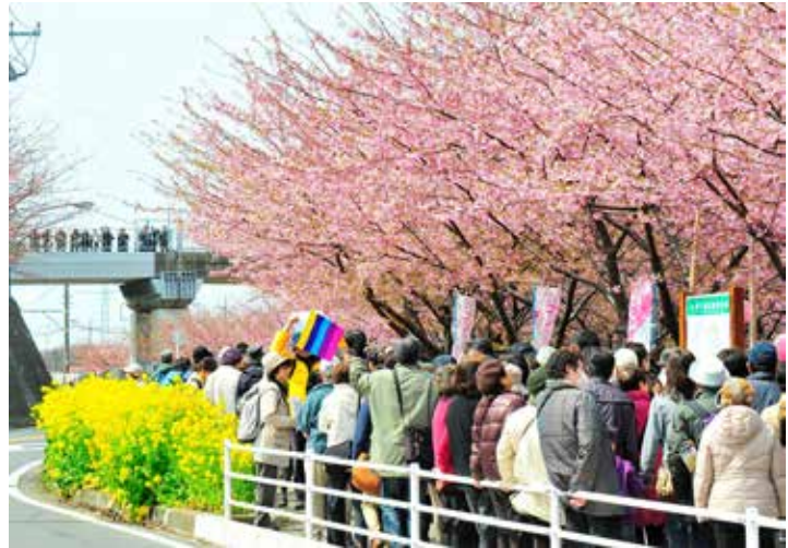
三浦海岸桜まつり（小松ヶ池公園付近）