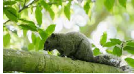
クリハラリス( タイワンリス )