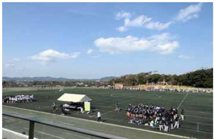
三浦スポーツ公園（潮風スポーツ公園）