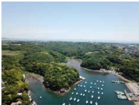
相模湾へとつながる小網代の森

森、川、海をつながりが必要なアカテガニをはじめとして、2,000種とも言われる多くの生きものが棲んでいます。神奈川県、三浦市、(公財)かながわトラスみどり財団、NPO法人小網代野外活動調整会議が連携し、管理するとともに、地域住民や多くの市民、企業等と手を携えながら、地域の宝として小網代の森を次世代に引き継いでいく必要があります。