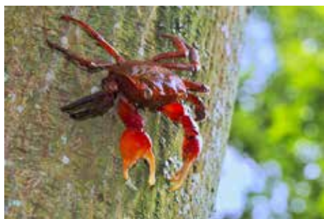
小網代の森のシンボル アカテガニ