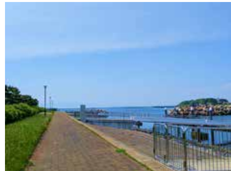
公共施設緑地（二町谷北公園）