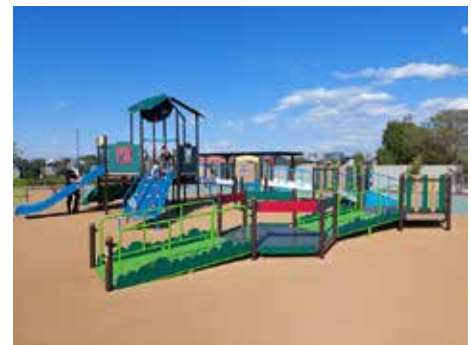
インクルーシブ遊具（イメージ）