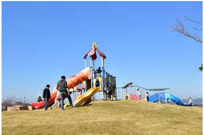
三浦スポーツ公園（潮風スポーツ公園）