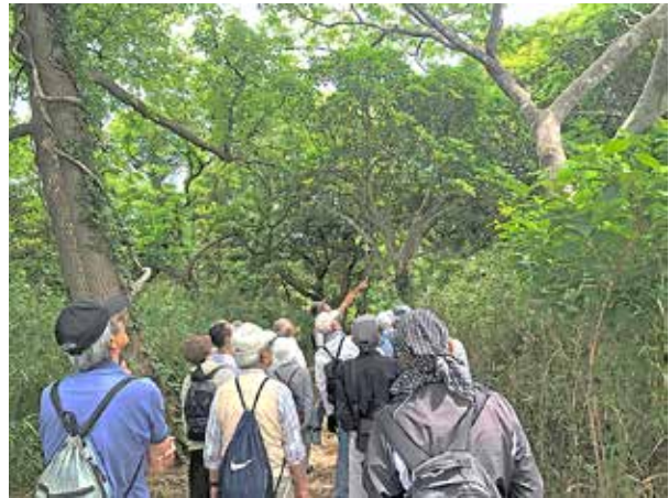
自然観察会 名向崎緑地