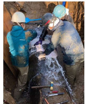
※写真は令和4年1月に発生した小網代地区の水道管漏水の様子

収入は減少しても、施設の更新・耐震化は重要です。 将来に備えるには、もっとお金が必要なのです。