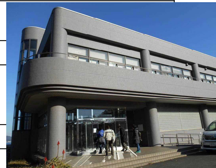
東部浄化センター