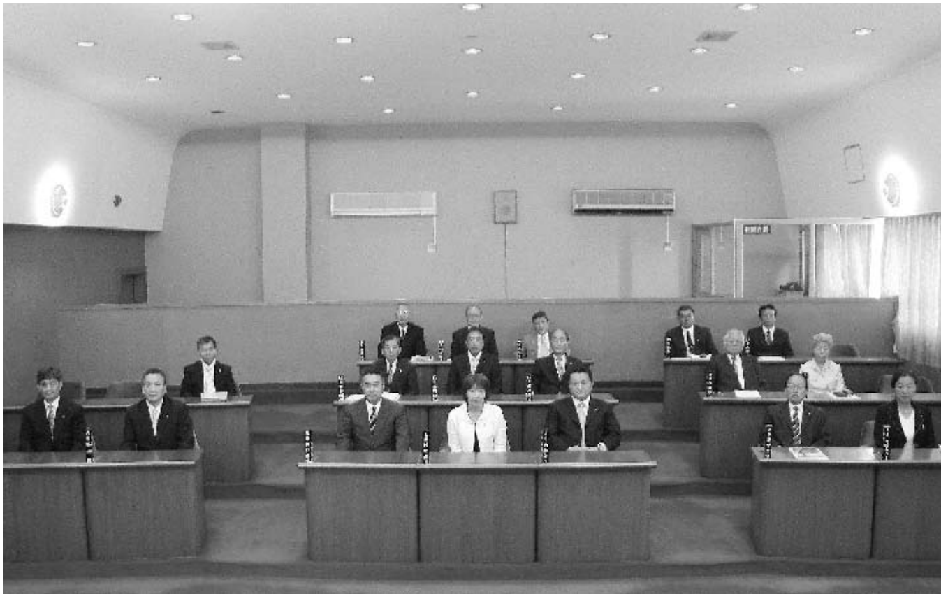
本会議場における各議員（平成19年5月15日）

去る四月二十二日に行われた統一地方選挙で当選した十八人の議員は、五月一日から第十四期議員として、四年間の議員活動をスタートさせました。