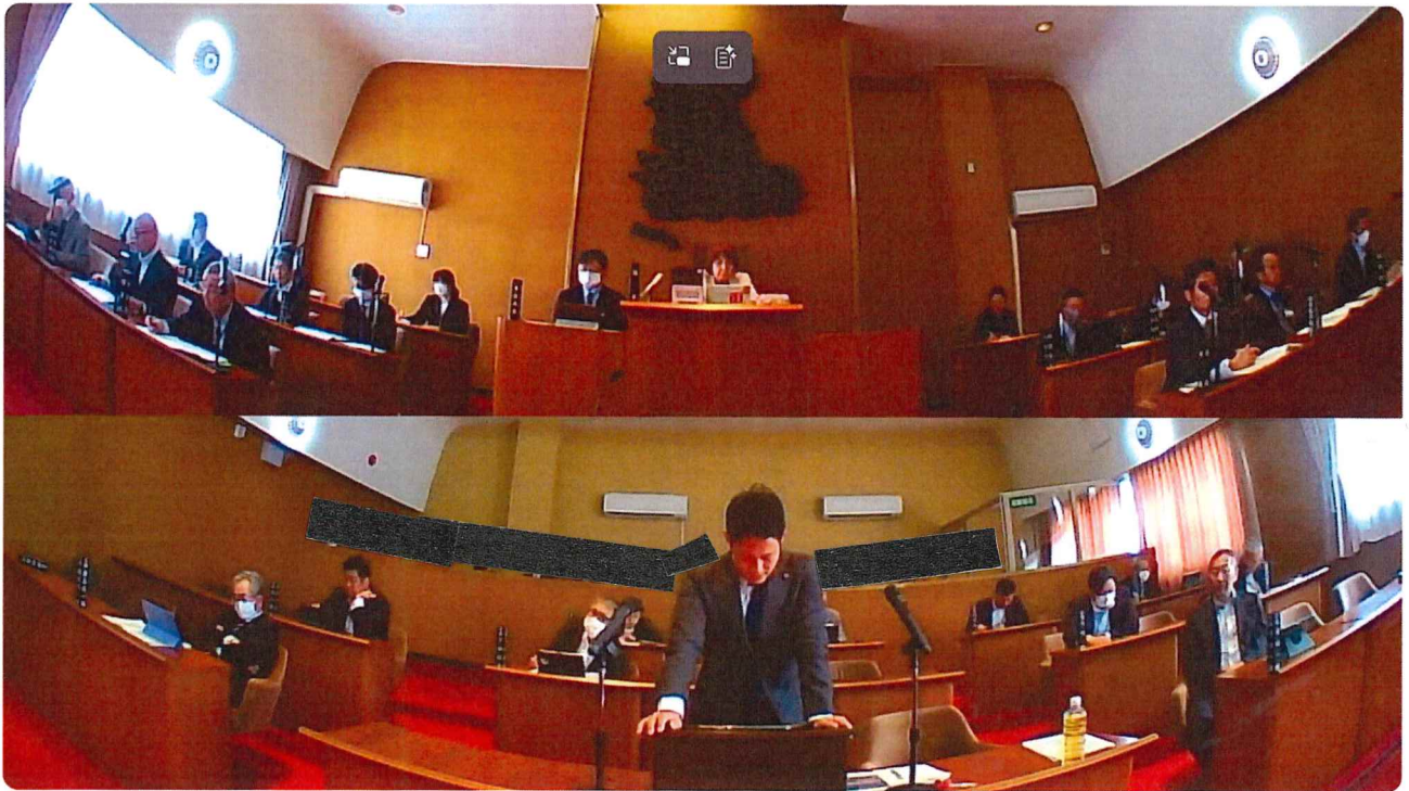
令和8年3月2日 本会議3日目② 一般質問