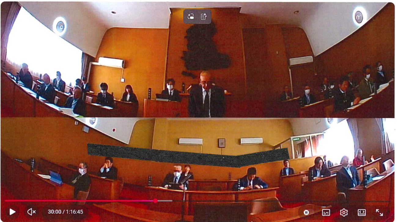
令和8年3月24日 本会議5日目① 委員長報告、決議案、人事案件、閉会中継続審査申出