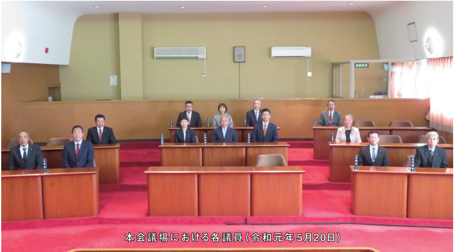
本会議場における各議員(令和元年5月20日)

第 137 号 令和元年(2019年)6月1日 編集：議会だより編集委員会 発行：三浦市議会 〒238-0298 神奈川県三浦市城山町1番1号 ☎ 046(882)1111内線462・463