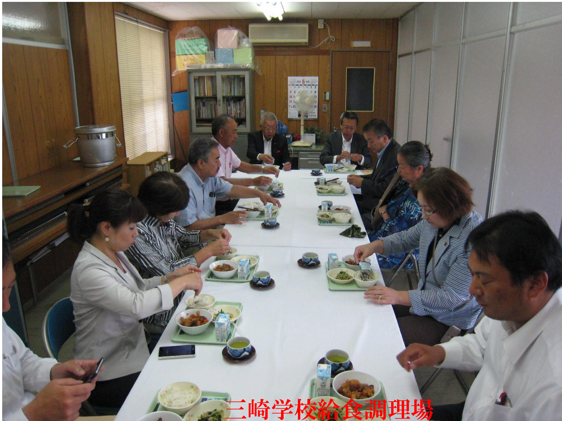
三崎学校給食調理場