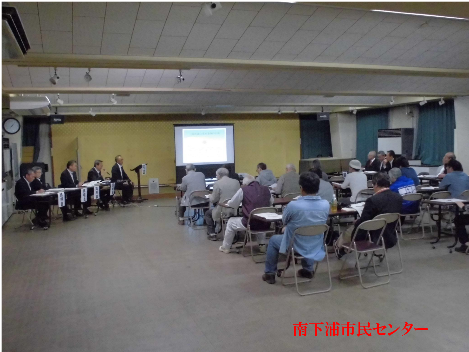
南下浦市民センター