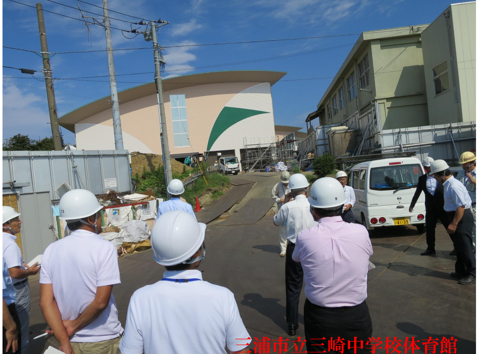
三浦市立三崎中学校体育館