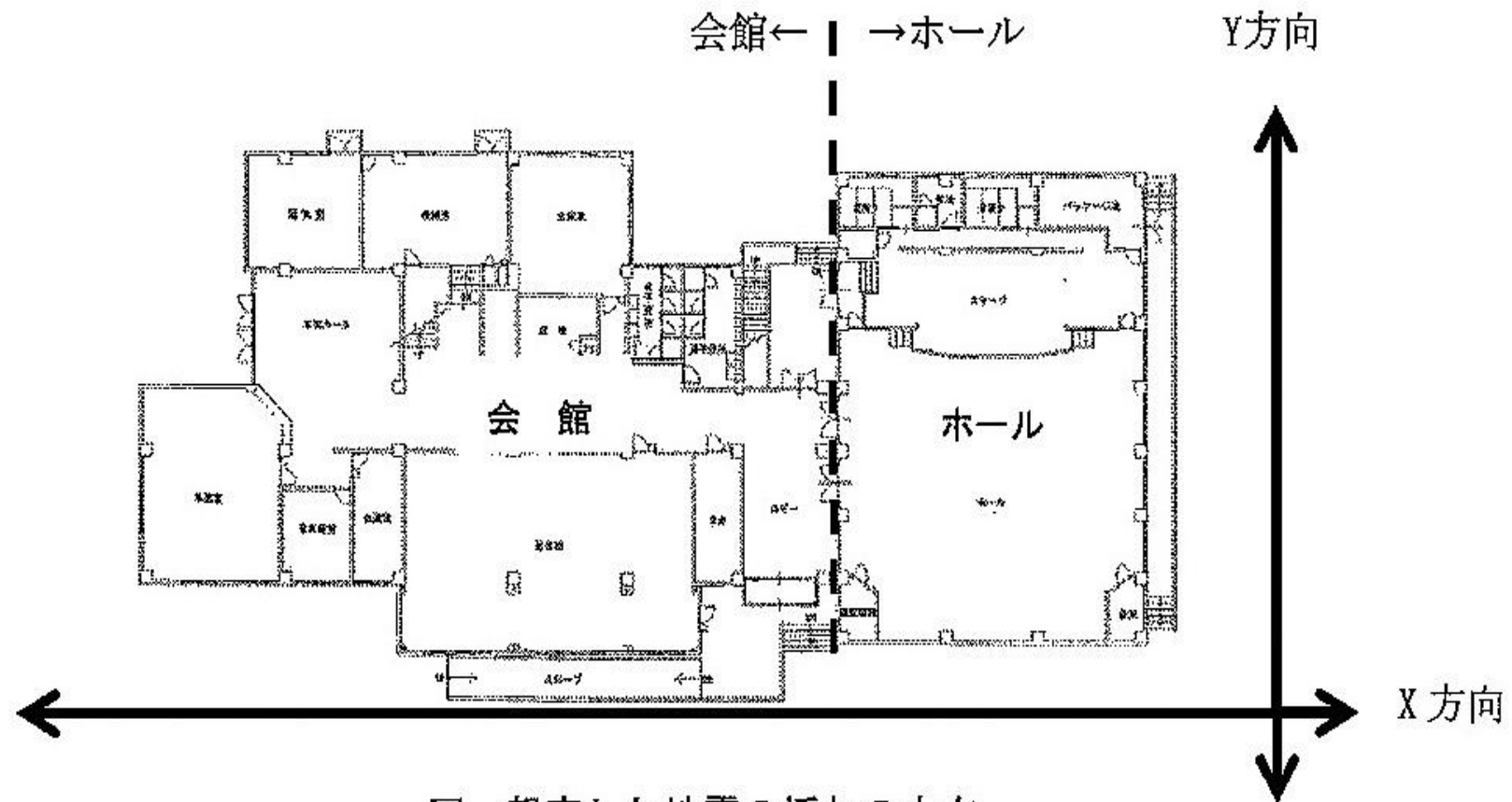
図 想定した地震の揺れの方