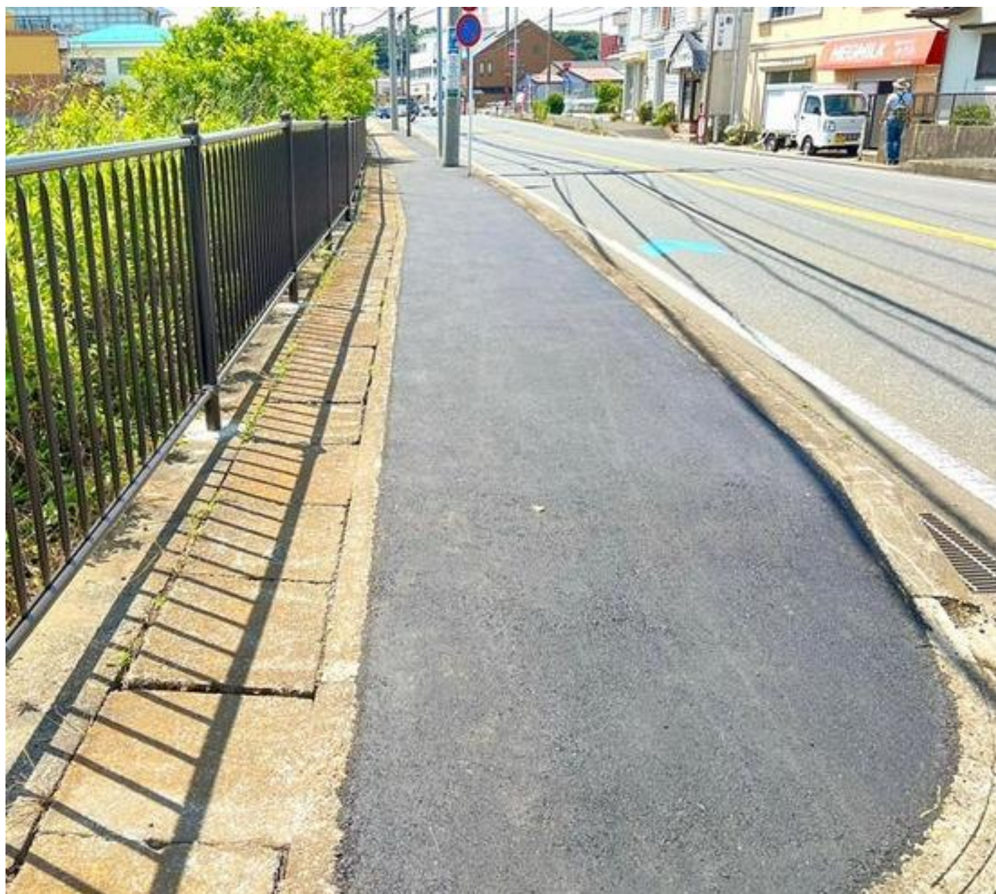
アスファルト補修