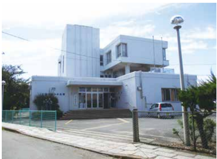
三浦市青少年会館