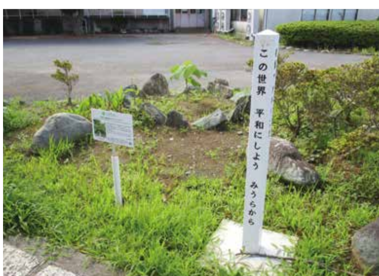
被爆アオギリ二世