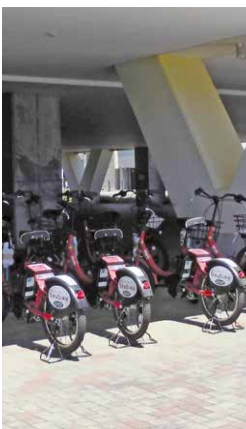
9月まで試行中のベイバイク

市長 ゴールデンウィークに実施したレンタサイクルの実験は、回遊性の向上を図るものであり、新たなレンタサイクル事業として事業化するには、さら