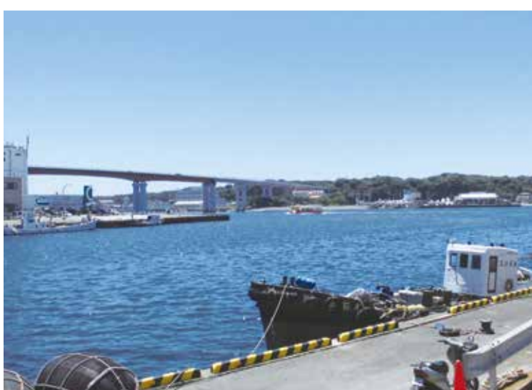
城ヶ島の活性化に向けて

社センター三階で実施されているが、十分な広さがあるとは言えず、利用者のこれ以上の受け入れは難しい。移転も含めて三浦市の療育を充実させる必要があると考えるが、今後、すくすく教室の事業をどのように展開していくか、考えをお聞きしたい。