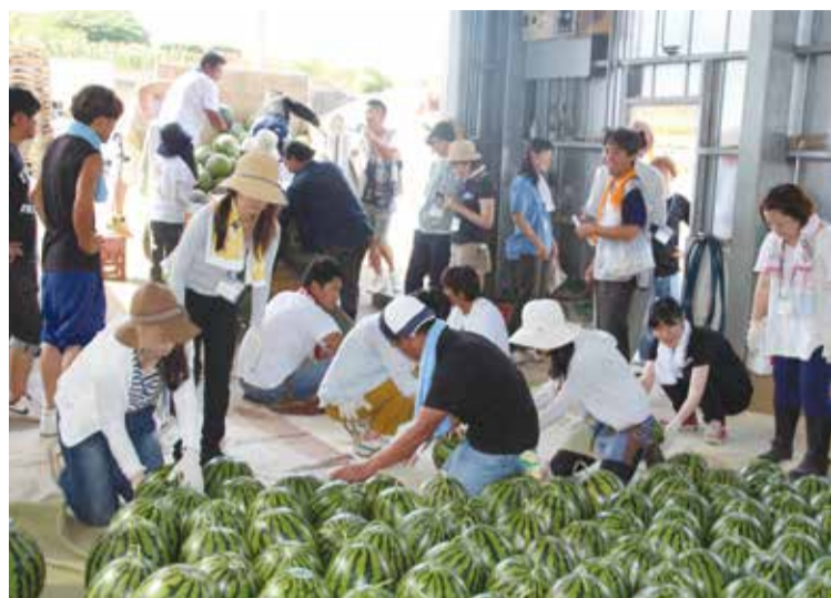
昨年のアグリdeデート

市長 事業者選定の際に、地域活性化への波及効果が期待できることからベイスシアの提案を評価しており、ぜひ実現させたいと思っている。販路拡大や地域情報