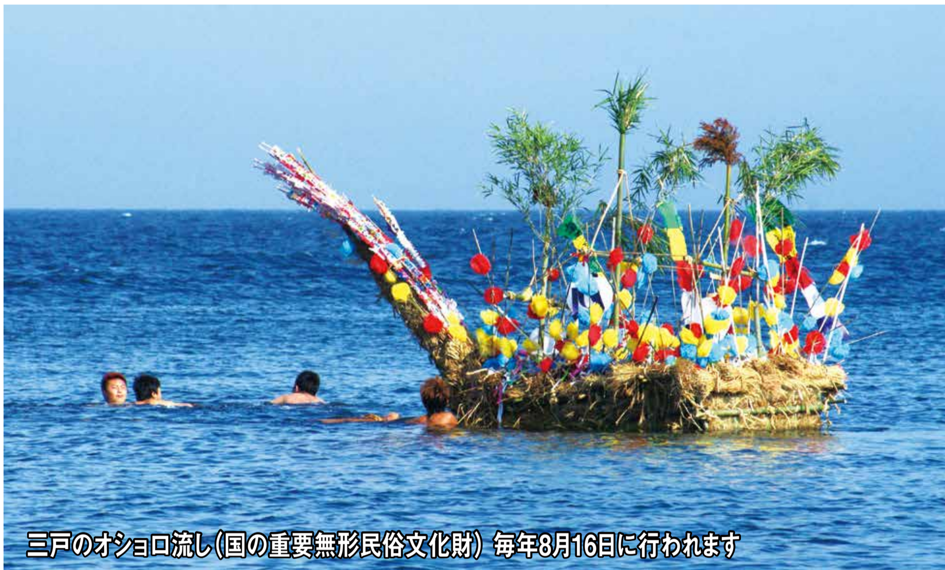
三浦のオショロ流し(国の重要無形民俗文化財) 毎年8月16日に行われます

第 121 号 平成27年(2015年)8月1日 編集：議会だより編集委員会 発行：三浦市議会 〒238-0298 神奈川県三浦市城山町1番1号 ☎ 046(882)1111内線462・463