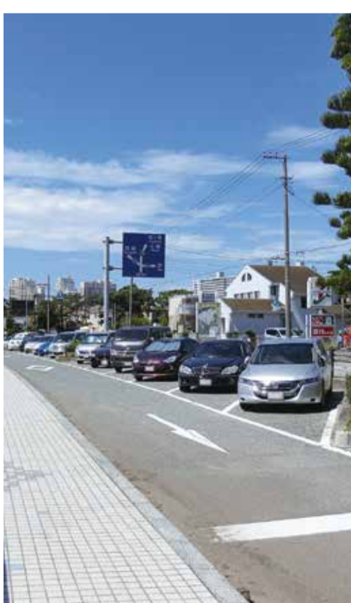
三浦海岸の駐車場

市長 海岸の駐車場拡張の要望を受け、県とも調整をしているが、実現は厳しく、新たな大型バス駐車場の確保は容易ではない。シャトルバスの運行など、課題解決に向けて、地元の方々と協議していきたい。