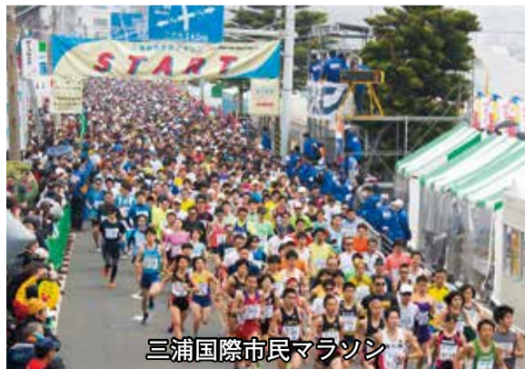
三浦国際市民マラソン

市民部長 商工会議所等との共催で労務管理講座を開催し、女性が活躍できる環境づくりに理解を求め、機会を捉えて啓発活動を実施していきたい。