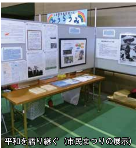
平和を語り継ぐ (市民まつりの展示)

今年度は、秋のおはなし会や図書館ビンゴなどに取り組んでいるが、この内容をお聞きしたい。