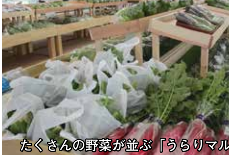
たくさんの野菜が並ぶ「うらりマルシェ」