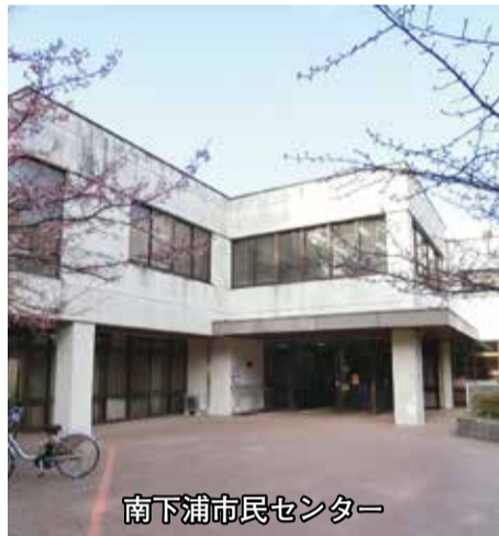
南下浦市民センター

市は子育て世代の転入促進のため、南下浦市民センター用地を対象に、PPP * を活用した子育て賃貸住宅の整備を検討している。