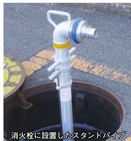
消火栓に設置したスタンドパイプ