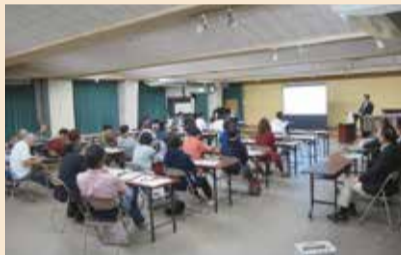
当日の様子(南下浦地区)

Q：学校施設の修繕の要望すべてに対応するのは財政的に厳しいことは理解している。一年で数校でも修繕すればよくなっていくと思うので、検討をお願いします。 A：学校施設の修繕の要望すべてに対応するのは財政的に厳しいことは理解している。一年で数校でも修繕すればよくなっていくと思うので、検討をお願いします。 アンケートから ・テーマを絞り関係者を絞るのはよい。このようなことは、継続が必要。 ・会全体の雰囲気が若干硬いと感じた。もっと広く市民が参加しやすい環境があるとよい。