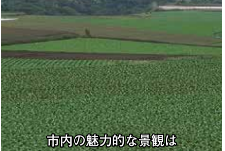
市内の魅力的な景観は