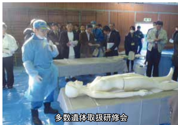
多数遺体取扱研修会

制を強固なものにするため、警察や陸上自衛隊と協議会を設立した。先般も三崎警察署と市の共催により多数遺体の取り扱い研修を実施するなど、さまざまな連携をしている。