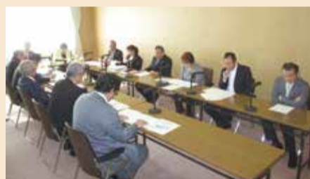
議会運営委員会での意見交換

議会報告会開催後は、各地区を担当した班ごとに報告書の作成やアンケートの集計を行いました。 その後、十一月十七日に議会運営委員会を開き、全議員出席のもとに議会報告会の総括を行いました。 総括では、各班の代表者から開催結果が報告され、その後、意見交換を行いました。