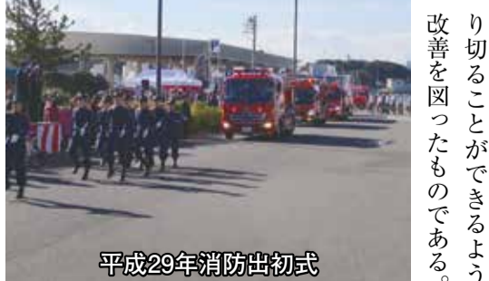
平成29年消防出初式

また、新消防庁舎には、本市の防災課も機能を移すので、災害対策本部設置後は消防と防災との情報交換等がより一層密にできるものと考えている。