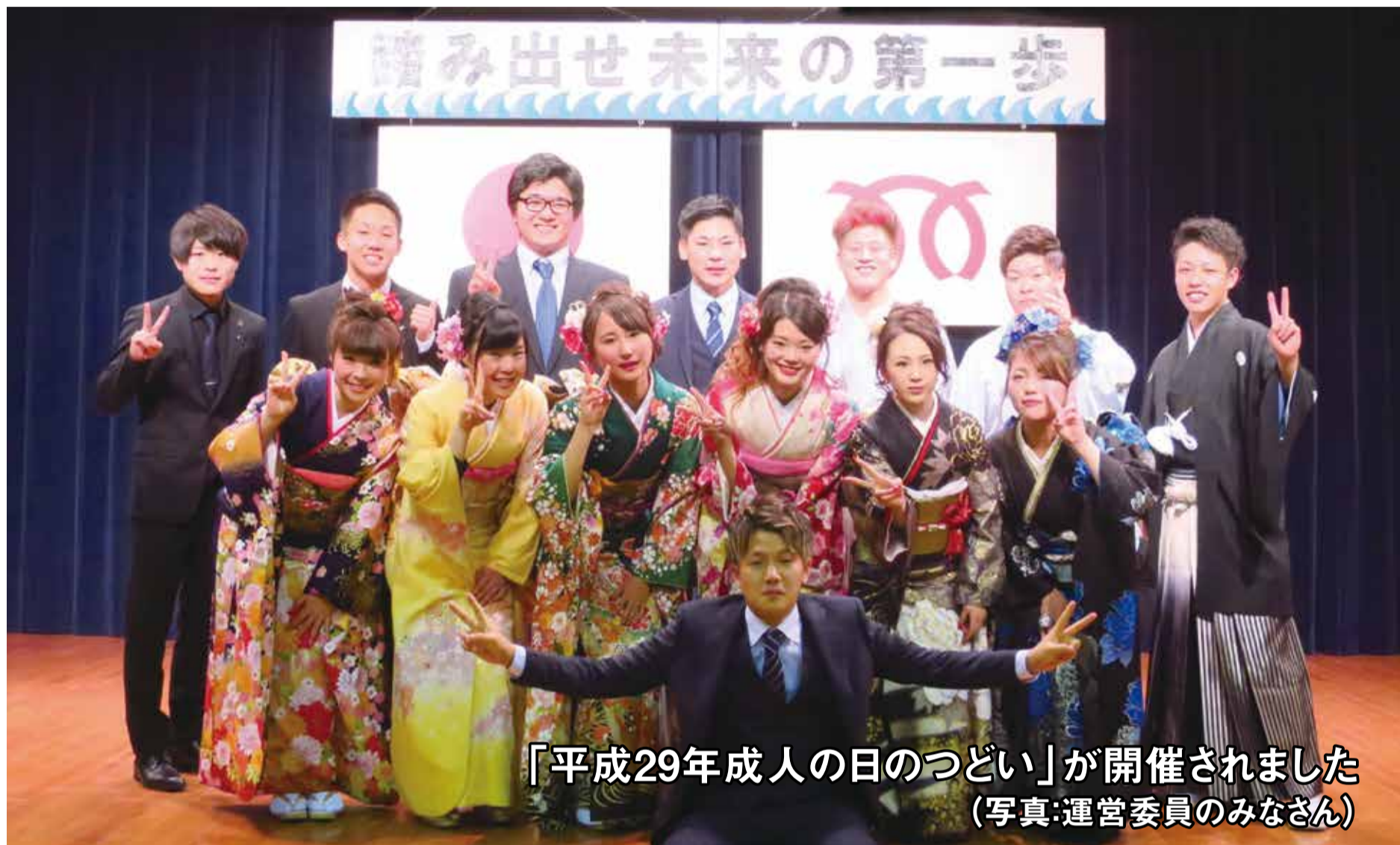
「平成29年成人の日のつどい」が開催されました (写真:運営委員のみなさん)

第 127 号 平成29年(2017年)2月1日 編集：議会だより編集委員会 発行：三浦市議会 〒238-0298 神奈川県三浦市城山町1番1号 ☎ 046(882)1111内線462・463