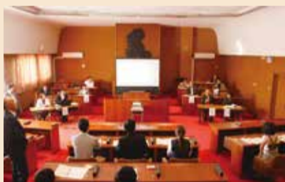
当日の様子(三崎地区)

Q：今、高校一年生だが、有権者になったときに、立候補者の情報を得るには、どのような方法があるか。A：学校の社会科の授業の中で学ぶようになります。 意見・要望 ・選挙は堅苦しいイメージがあるので、何か面白いことをすれば若い世代の投票率が上がると思う。 アンケートから ・政治にもっと関心を持つと思う。 ・選挙や三浦市について考えるきっかけができたのでよかった。