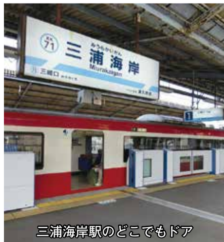
三浦海岸駅のどこでもドア

市内での取り組み 質問 女性の活躍推進法が二十八年四月に施行され、女性の活躍推進に向けた行動計画の策定等が市に義務づけられた。