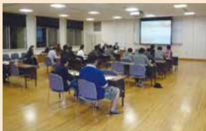
当日の様子(初声地区)

Q：人口・雇用対策等として「三浦版CCRC構想」の説明があった。この中で述べられた、移住者であるアクティブシニアの定義は。A：健康でアクティブに活躍できるシニアを指している。 Q：仕組みづくりは分かったが、具体的な策は何かあるか。A：クラブハウス等の付帯施設を備えた分譲