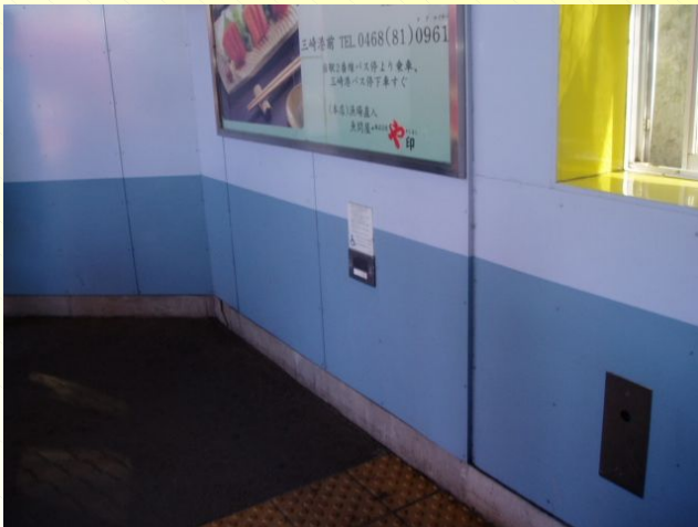
ホームエスカレーター横呼出ボタン

エスカレーターは通常上り専用となっていますが、駅係員が操作し下りで使用することもできます。