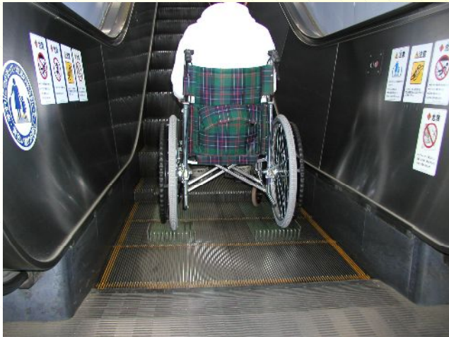
エスカレーター車いす用安全装置