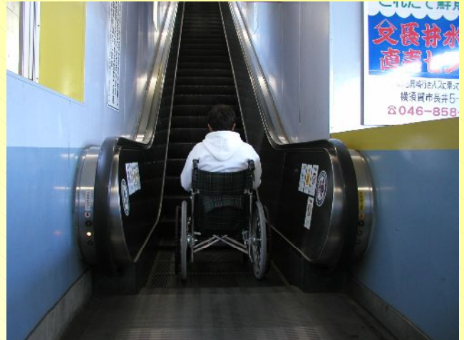
エスカレーター設置状況