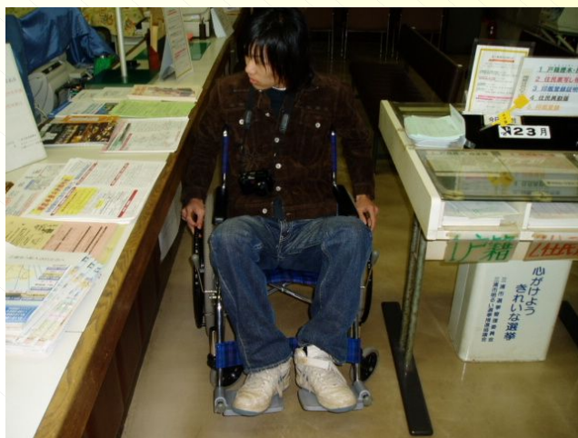
カウンター周辺通路