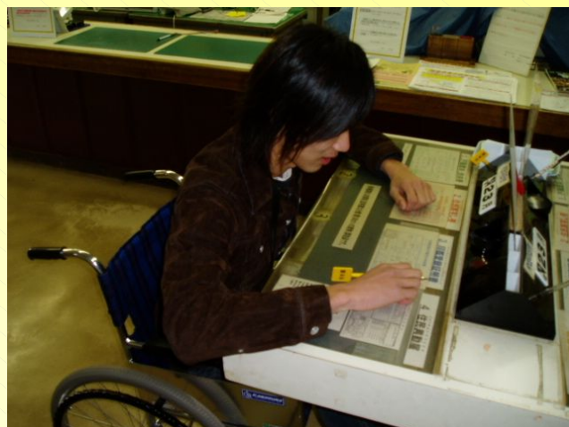
各種申請書記入用カウンター