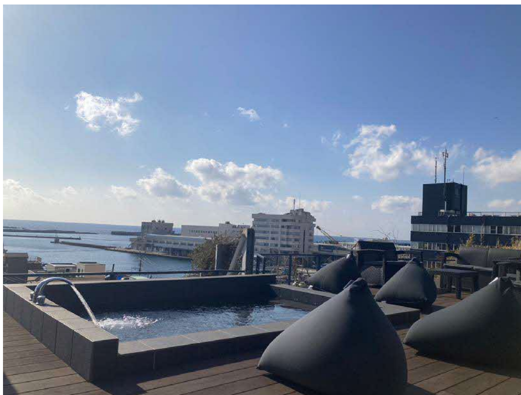
「本陣」屋上からの景色

ミウラトラスト株式会社（本社：神奈川県三浦市）が運営する「三浦半島の旅宿 三崎宿」は、歴史的な邸宅や古民家を改修した分散型ホテル「蔵宿」「旅宿」「酒宿」に「本陣」を新たに加え4棟8室体制として、2023年3月1日(水)にグランドオープンいたします。