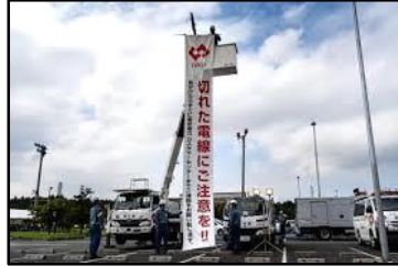
東京電力パワーグリッド