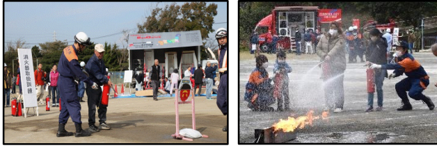
消火器による消火