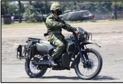
陸上自衛隊 偵察バイク