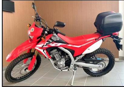
三浦市役所 偵察バイク