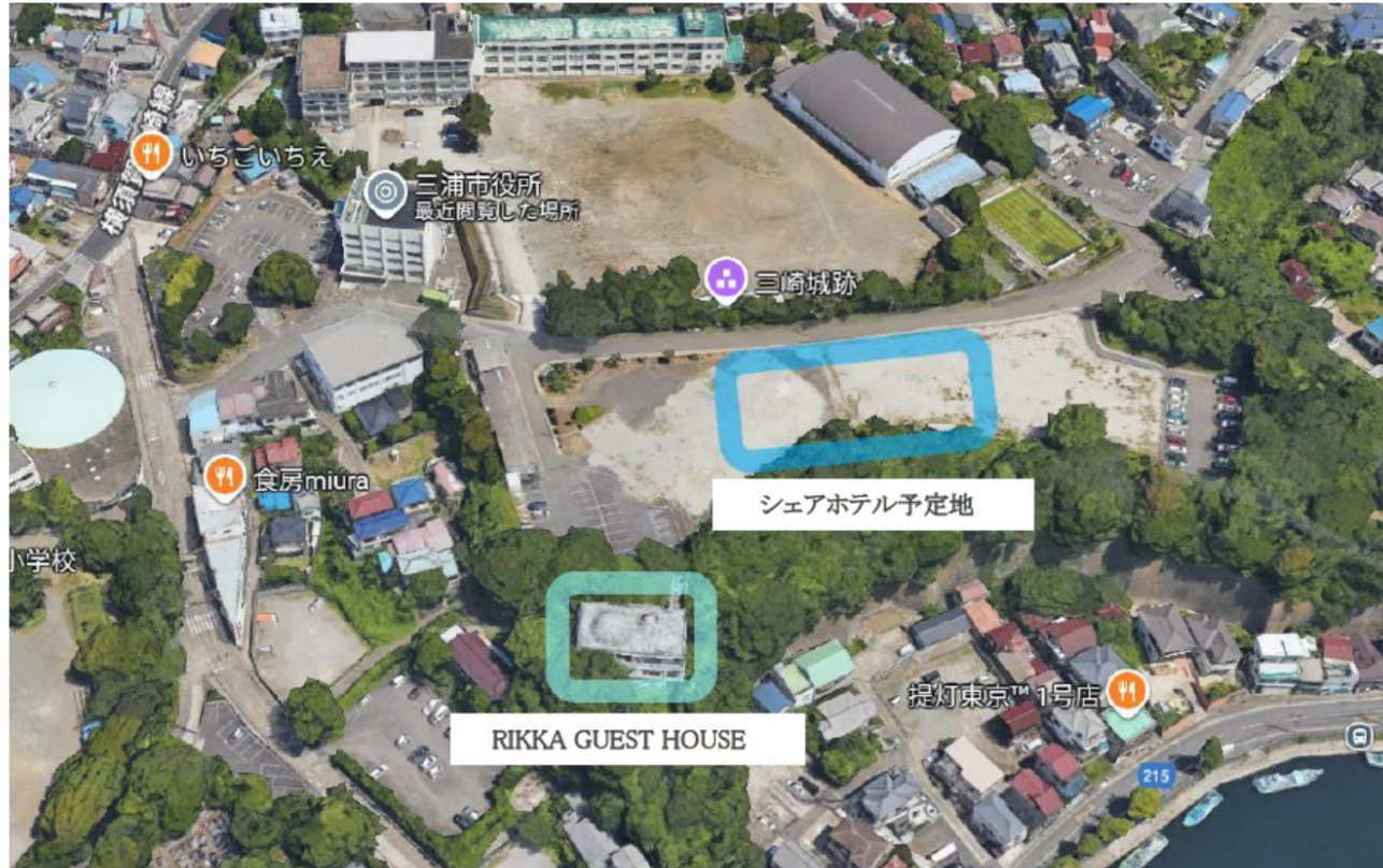
プロジェクト活用箇所