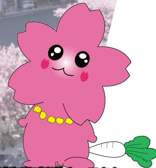
三浦海岸ご当地キャラクター 「みうらん」