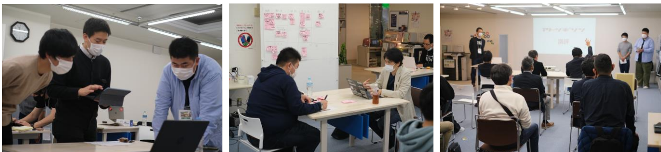
昨年実施した「アトツギ新規事業開発プロジェクト in 三浦半島」の様子